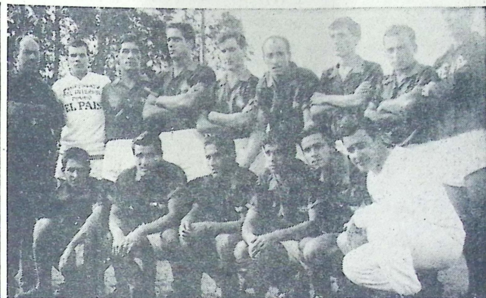
ATENAS DE SAN CARLOS

Atenas de San Carlos, primer campeón del Torneo de Clubes Campeones. El que dio la tónica y la importancia de esta competencia, el que llevó al fútbol del interior el ejemplo de un esfuerzo, de una adhesión de pueblo magnífica, el que hizo vivir a una ciudad días de gloria y euforia deportiva y social