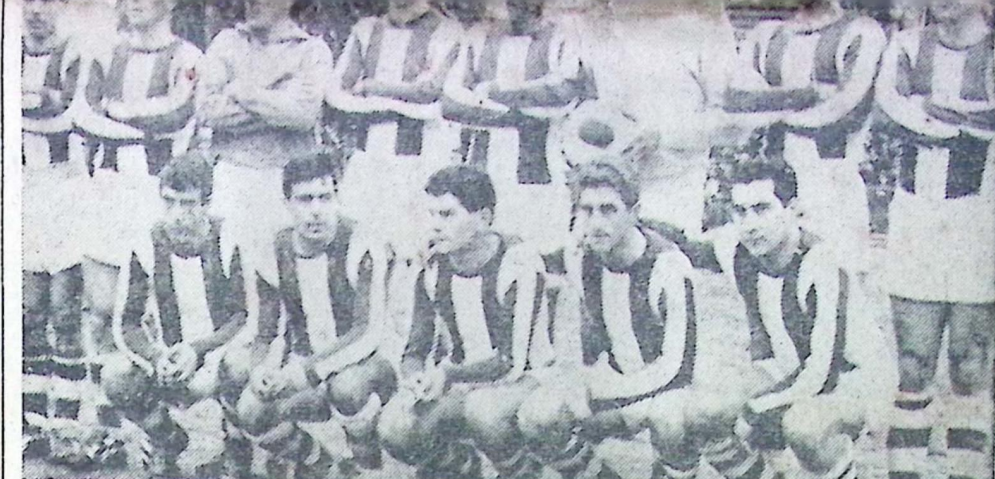
UNIVERSAL DE SAN JOSE

Universal de San José, los campeones del último Torneo disputado. Los que devolvieron para el fútbol maragato las resonancias gloriosas, expresando la calidad de un fútbol que siempre dió grandes valores. Universal defiende nuevamente todo ese acervo y también el Gran Trofeo EL PAIS que está en su poder