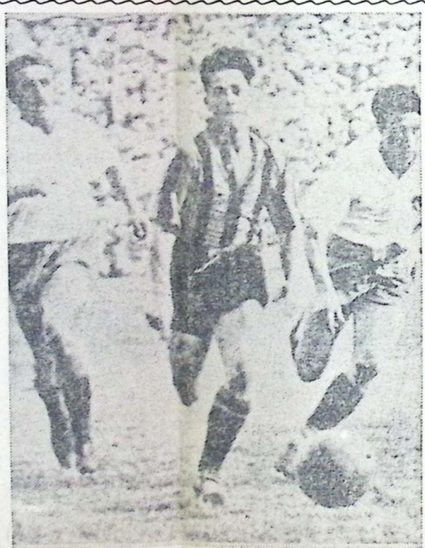
Dos jugadores de Nacional y uno de Peñarol, durante un clásico de hace muchos años. Diga usted quiénes son los tres players y ganará una pelota que regala CASA SANZ de Uruguay y Rondeau. Las respuestas deben enviarse a esta Redacción o a Casa Sanz. Tiene plazo hasta el sábado próximo

PARECE mentira que a esta altura de la vida del fútbol aun se permitan tantos excesos. Si el juez ordena una cortina, le sale al paso un player para discutir la distancia. Si el árbitro pena un foul en determinado lugar, siempre hay alguien que pone la pelota más atrás y desde luego, llega en seguida quien la pone más adelante. Si alguien se lesiona —a veces nadie se lesiona pero lo mismo hay revolcones y gran charla— todos se amontonan, todos hablan, llega gente de afuera, llaman a otros, se van algunos... Es el momento de la gran kermesse pública y el de la gran jarana. No decimos nada cuando el jugador le discute violentamente al juez un fallo que puede ser peligroso para su valla. Es cuando hay cinchadas, gritos, gestos airados y pérdida abundante de tiempo. Un tiempo precioso que se pierde y que tenemos nuestras dudas de que se agregue "a los noventa" al final del encuentro.