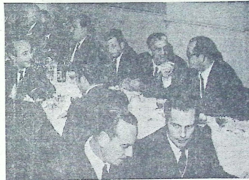
CENA DE PRIMERA "B"